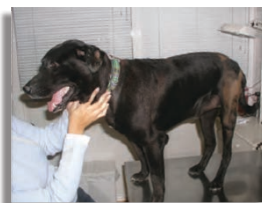
После 3-х месяцев лечения с применением ВЕТОРИЛА