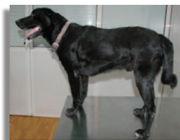
После 9-и месяцев лечения с применением ВЕТОРИЛА