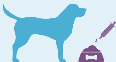
1 ml prípravku VetCalm® na 1 kg telesnej hmotnosti. Jednoducho pridajte do jedla.