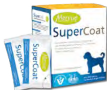
10 ml (střední plemena)