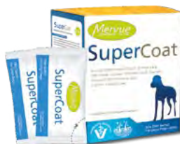
15 ml (velká plemena)