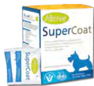
5 ml (malá plemena)