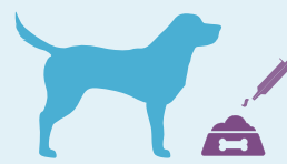
1 ml přípravku VetCalm® na 1 kg tělesné hmotnosti. Jednoduše přidejte do jídla.