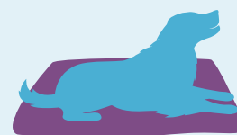
Upokojenie Vášho miláčika