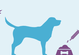
1 ml prípravku Veticalm® na 1 kg telesnej hmotnosti. Jednoducho pridajte do jedla.